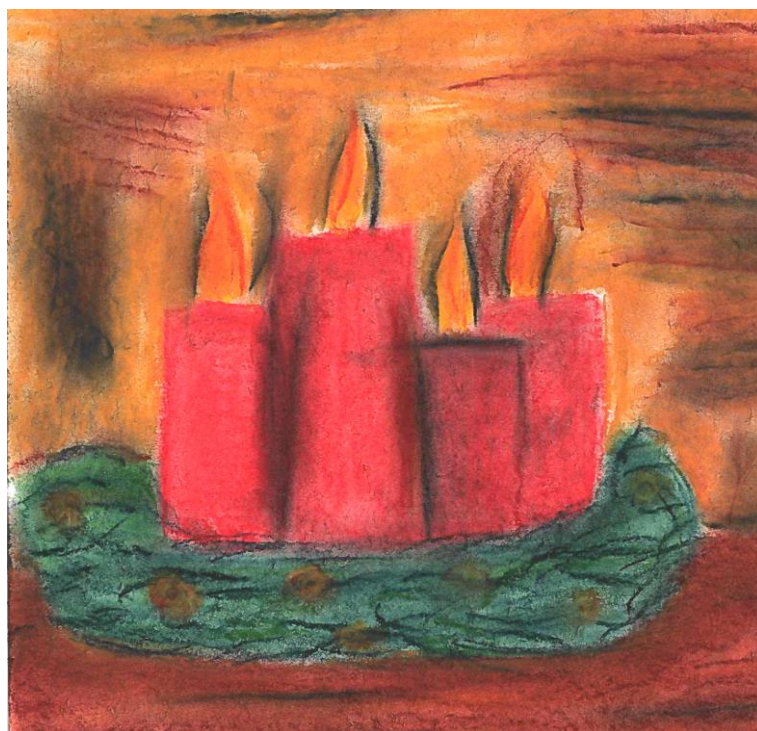
Reuter Isabell, Klasse 8